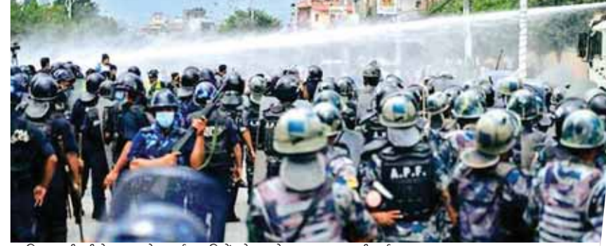
पुलिस पानी की तेज धार से प्रदर्शनकारियों को हटाने का प्रयास करती हुई