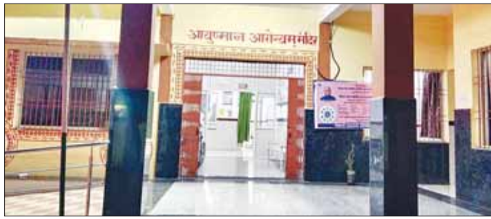
अस्पताल में रात्रि में नहीं हो पा रही है एमएलसी

बरेला। नेशनल हाईवे 30 पर स्थित शासकीय प्राथमिक स्वास्थ्य केंद्र बरेला में वर्तमान में रात्रि में डॉक्टर की व्यवस्था न होने के कारण यहां की चिकित्सा व्यवस्था पूर्णतः भगवान के भरोसे चल रही है। नेशनल हाईवे होने के कारण यहां पर आए दिन दुर्घटना होती रहती हैं किंतु रात्रि में डॉक्टर न होने के कारण यहां पर मरीज को प्राथमिक उपचार न मिलने के कारण जिला चिकित्सालय रेफर करना पड़ता है इसकी वजह से कभी-कभी मरीजों को अपनी जान से हाथ भी धोना पड़ जाता है किंतु स्वास्थ्य विभाग द्वारा अस्पताल में रात्रि कालीन डॉक्टर की व्यवस्था न करने के कारण आम जनों को कठिनाइयों का सामना करना पड़ रहा है।