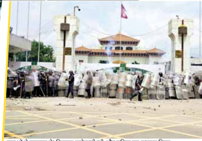
युवाओं ने सरकार के खिलाफ नारेबाजी की और पुलिस पर पथराव किया